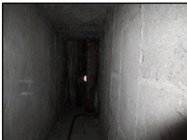
Photo N° 604 AMIANTE CIMENT -- Gaine technique 4 Gaines & coffres verticaux Ventilation haute (Fibres- ciment)

Dossier n°: 2013-09-300 FK DTA PC017LADOPH