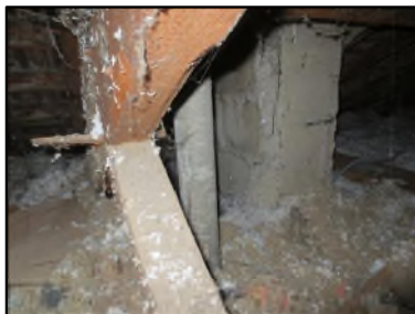
Photo N° 605 AMIANTE CIMENT -- Combles Conduits de fluide Ventilation haute (Fibres-ciment)